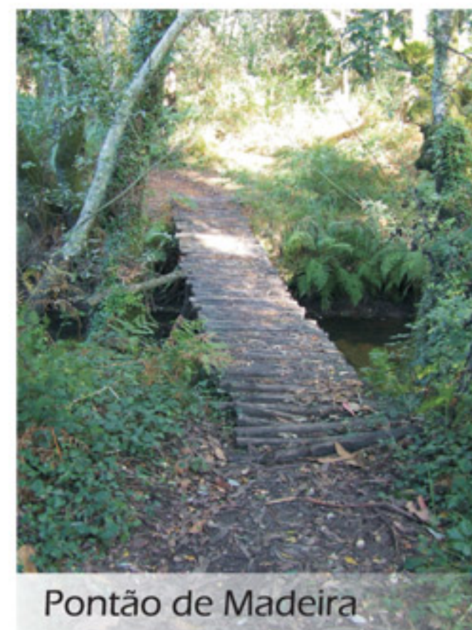
Pontão de Madeira

Na margem esquerda as ruínas de um engenho, o de Esprade, na margem direita, a Azenha do Grilo, que embora situada na freguesia de S. Romão do Neiva, Viana do Castelo, é propriedade de naturais de Antas e foi explorada por pessoas da nossa terra. Continuemos, agora a nossa caminhada na margem do Rio Neiva e é ver frondosos carvalhos,