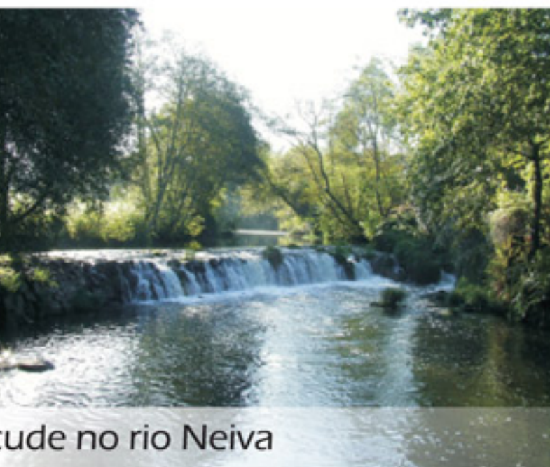
Açude no rio Neiva

podem ver no Instituto de Antropologia do Porto. Deixamos para trás o casario e entramos na zona de floresta conhecida por Peneirada. Logo no início vamos encontrar uma ruína de um antigo Moinho de Vento e que pela sua localização mostra as alterações que sofreu a vegetação. Continuamos a nossa caminhada por entre pinheiros, sobreiros, carvalhos e eucaliptos. Vamos encontrar destes últimos, junto ao trilho, dois exemplares de porte invulgar pelo seu tamanho e volume.