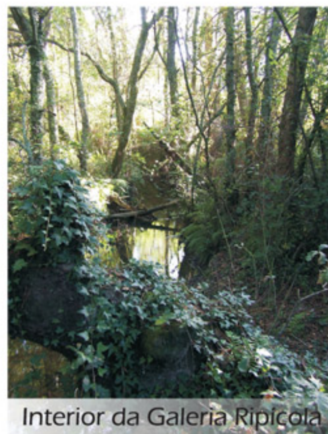
Interior da Galeria Ripícola

O monte, o vale, a planície, o rio, o céu azul com a mar ao fundo. Vamos continuar e percorrendo parte do interior da aldeia, subimos um pequeno carreiro que ladeia o local onde foi em 1939, foram encontradas várias necrópoles eneolíticas e que se