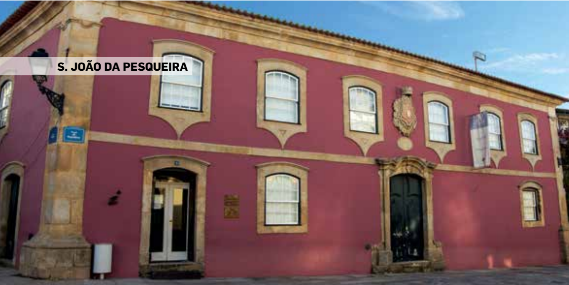
S. JOÃO DA PESQUEIRA