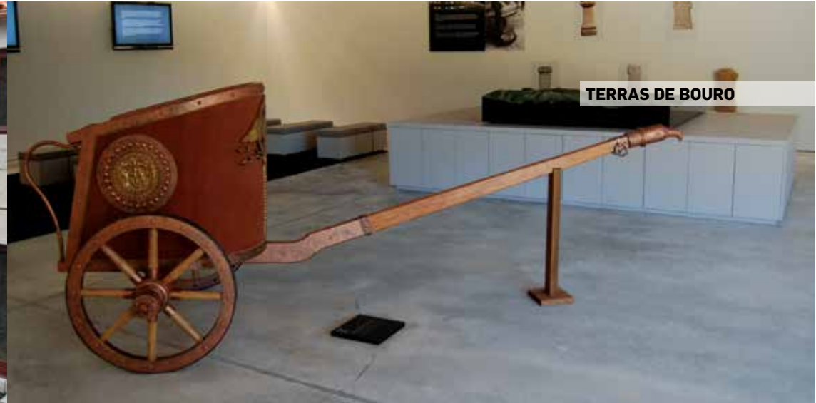
TERRAS DE BOURO

Rua Egas Moniz 3610-013 Tarouca GPS: 41° 2' 4.57" N 7° 45' 40.56" W tel.: 254 677 174 e-mail: casadopaco@cm-tarouca.pt site: www.cm-tarouca.pt