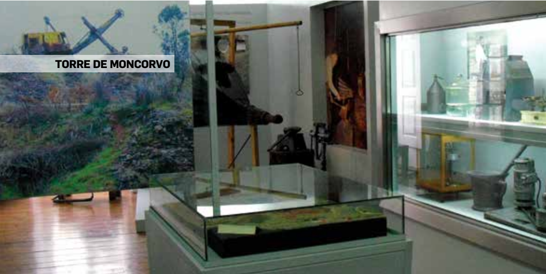
TORRE DE MONCORVO