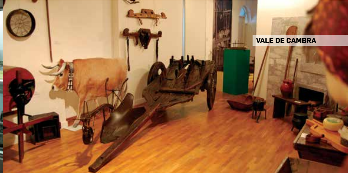
VALE DE CAMBRA

Largo Dr. Balbino Rego 5160-241 Torre de Moncorvo GPS: 41° 10' 23.78" N 7° 03' 11.73" W tel.: 279 252 724 e-mail: museu-ferro@hotmail.com site: www.mfrm-cdoc.blogspot.pt/ cardapio.pt