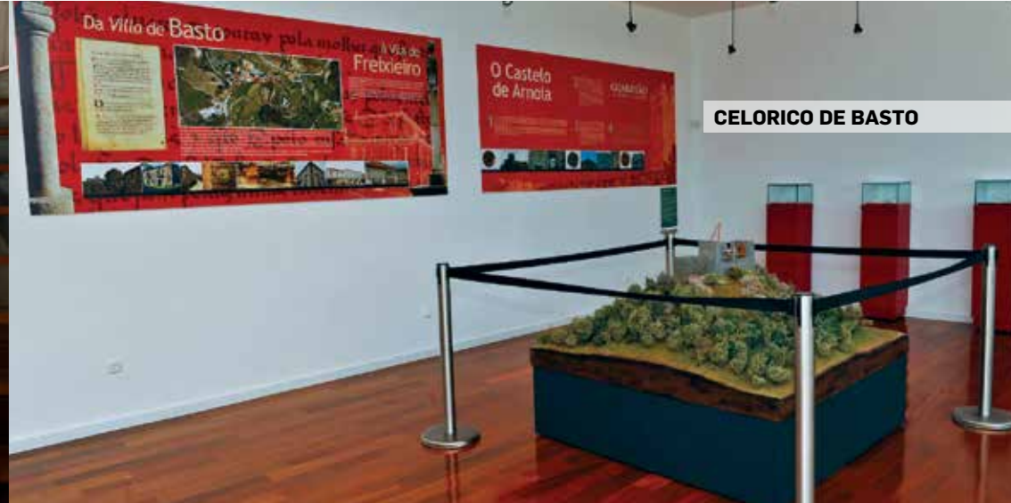
CELORICO DE BASTO

Rua Capitão Lobo 5140-097 Carrazeda de Ansiães GPS: 41° 14' 43.15" N 7° 18' 01.70" W tel.: 278 610 200/278 618 253 e-mail: cica@cmca.pt site: www.castelodeansiaes.com