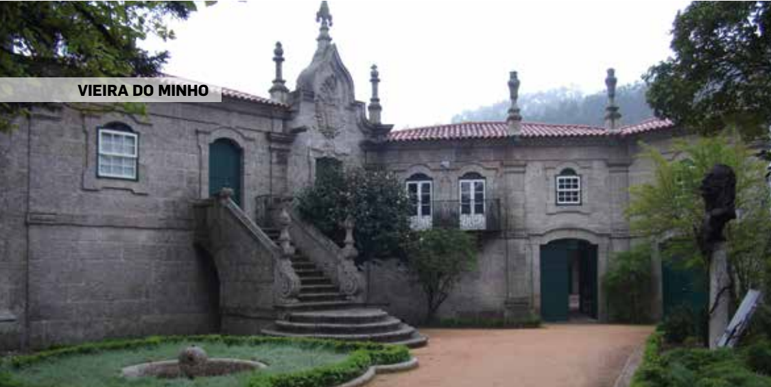
VIEIRA DO MINHO