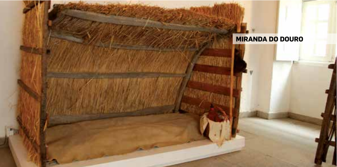
MIRANDA DO DOURO

Rua do Carvalho- Centro Histórico 4960-536 Melgaço GPS: 42°6'52.18" N 8°15'36.90" W tel.: 251 401 575 e-mail: museudecinema@cm-melgaco.pt site: www.cm-melgaco.pt