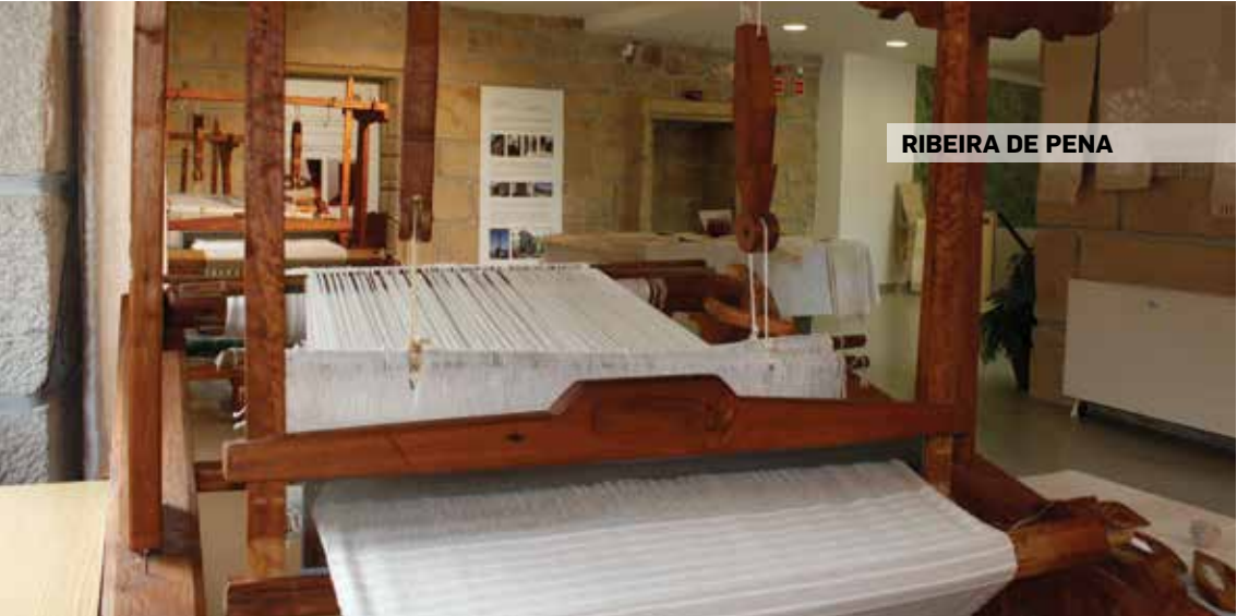
RIBEIRA DE PENNA

Rua Dr. Amadeu Sargaço 4660-238 Resende GPS: 41° 06' 15" N 7° 57' 33" W tel.: 254 877 200 e-mail: museu@cm-resende.pt site: www.cm-resende.pt