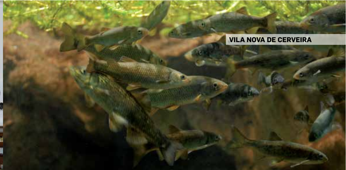
VILA NOVA DE CERVEIRA

Largo Dr. Alexandre de Matos 5360-325 Vila Flor GPS: 41° 18' 25" N 7° 9' 11" W tel.: 278 512 373 e-mail: museu.berta.cabral@mail.telepac.pt site: www.cm-vilafior.pt