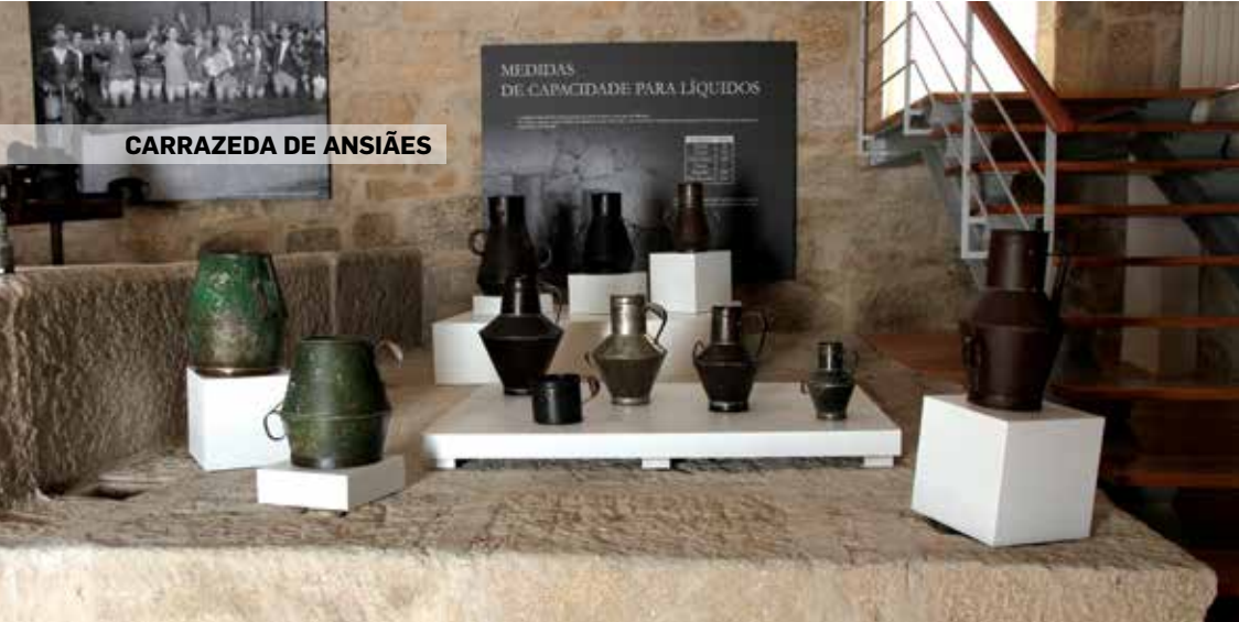
CARRAZEDA DE ANSIÃES