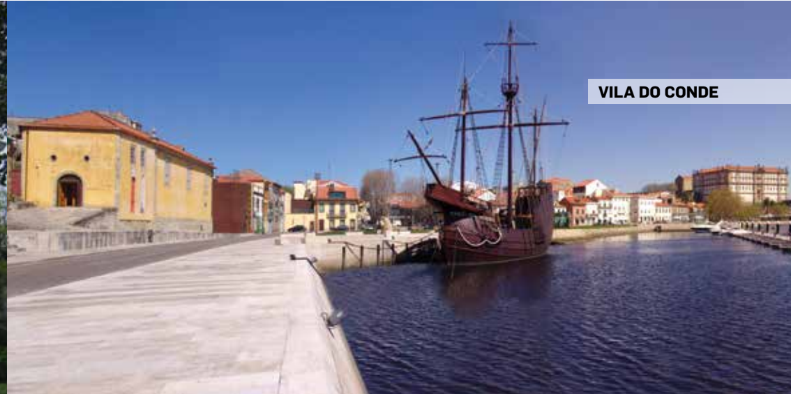
VILA DO CONDE

Largo Prof. Brás da Mota 4850-525 Vieira do Minho GPS: 41° 37' 56.87" N 8° 08' 29.27" W tel.: 253 741 249 /253 649 270 e-mail: casadelamas@cm-vminho.pt site: www.cm-vminho.pt / www.vieiradominho.pt